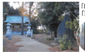
「鹿島神社」のある小高い丘が「東楯戸古墳」の跡だ。