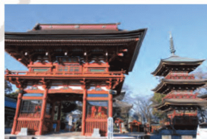
みらい平駅の東側にある「板橋不動尊」は、威風堂々たる建造物が目を引く。