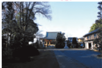
住宅街にひっそりと建つ「禅福寺」が二の丸跡という、広大な城跡。