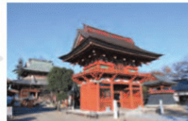
真言宗豊山派に属する寺院。本堂、楼門、三重塔は江戸中期の作。