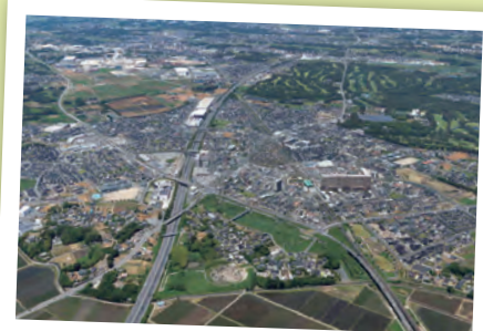
みらい平の街並み