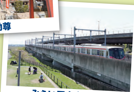
みらい平さくら公園