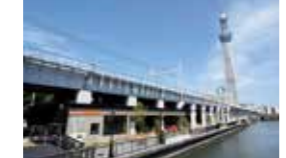
鉄道高架下に誕生したショップ&レストラン街。

千住宿歴史プチテラス 江戸時代に建てられた内蔵を移築。ミニ展示会などが開かれている。