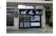
古くから一帯が花見の名所だったため、桜餅が名物に。