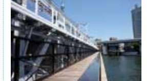
東武スカイツリーラインと併行する隅田川に架かる歩道橋。