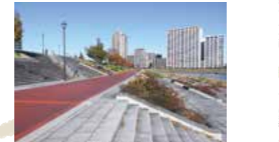
隅田川沿いに整備された「汐入公園」は、川沿いにウォーキング道があり歩きやすい。