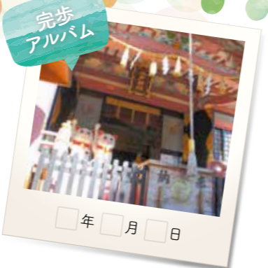
隅田川近くにある、コース前半で立ち寄る今戸神社。2体の狛犬が参拝者を出迎えてくれる。