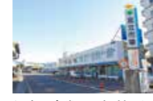
場内の食堂は一般利用も可能で、ランチスポットとしてもおすすめ。