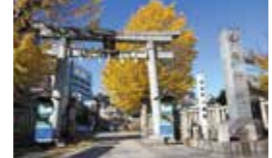
温和な容姿で福の神様として信仰を集める。福祿寿を祀る。