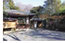
春のフジや秋のハギが名物の植物園。自然に近い状態が保たれ、野鳥や昆虫の宝庫でもある。