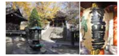
仏法を守護する大聖歡喜天を本尊として祀る、浅草七福神のひとつ。