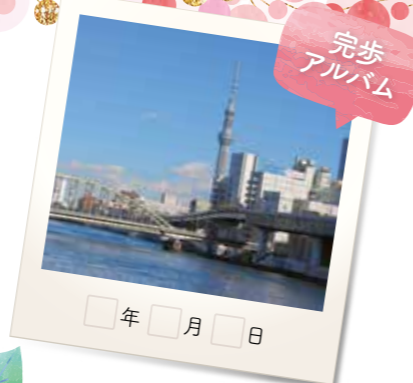
「両国橋」から眺めた東京スカイツリーと隅田川。 このコース一番の絶景スポット。