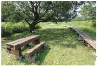
森林の中の起伏に富む野鳥の森散策路と 湿地の丸太敷きの鳥のみちが整備されている。