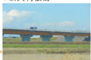
利根川を渡る長大な橋。下り路線側(下 流側)に歩道があり、歩いて渡ることが できる。