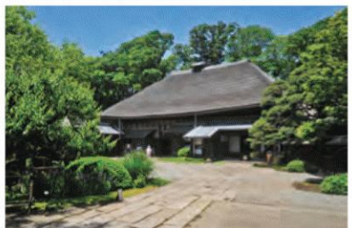
25mもの長屋門の先に広がるのは、茅葺き屋根の主 屋や書院など歴史的な建造物の数々。休憩できる広 場もある。