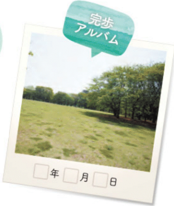
このウォーキングコースのハイライトは、豊かな木々に癒される「県立柏の葉公園」。