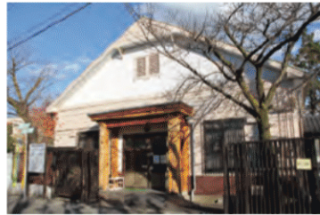
彦成小学校講堂記念館 かつて小学校の講堂だった建物を改装。 教育資料などを展示。