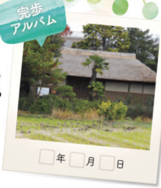
長屋、長屋門ともに江戸中期の建造という、 近世の居館を今に伝える「和井田家住宅」。

中川の両岸に点在する自然や見どころなどを巡りながら、 TXで直線に行けば1駅という距離をぐるりとウォーキング。