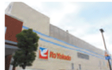
ピアラシティ イトヨーカドーなどの大型 ショッピング施設が集まる。