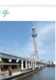
東武スカイツリーラインと併行する隅田川に架かる歩道橋。

TX浅草駅は浅草寺の西側にあって浅草寺前を抜けて東へ進むが、コースを少し外れて浅草の名所・雷門に立ち寄ってから、ウォーキングを始めるのもいい。