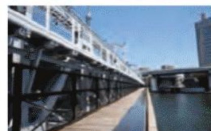
東武スカイツリーラインと併行する隅田川に架かる歩道橋。