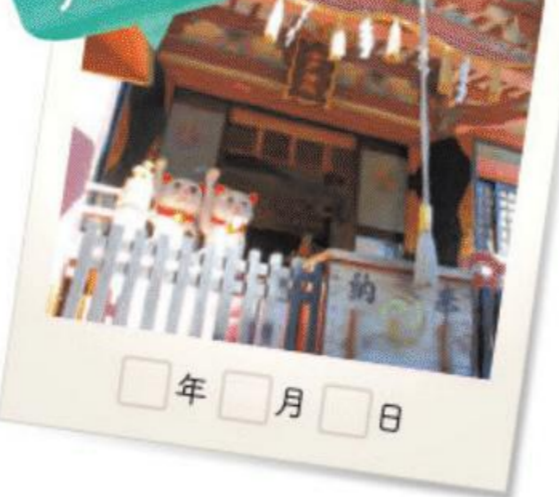
隅田川近くにある、コース前半で立ち寄る今戸神社。2体の招き猫が参拝者を出迎えてくれる。