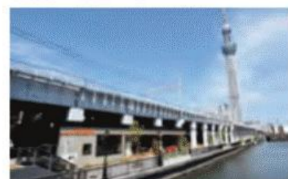
鉄道高架下に誕生したショップ&レストラン街。

千住宿歴史プチテラス 江戸時代に建てられた内蔵を移築。ミニ展示会などが開かれている。