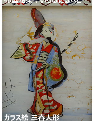
ガラス絵 三春人形