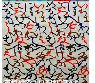
布型絵染：いろはにほへど