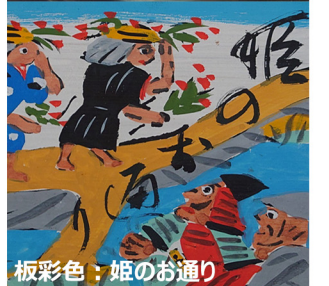
板彩色：姫のお通り