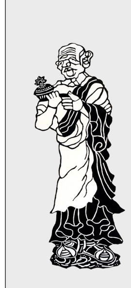
富楼那弥多羅尼子 furunamitaranishi