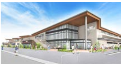
TOBU icourt/トーブイコート建物イメージ(パース)

2023年春、獨協大学前(草加松原)駅付近に、商業施設 TOBU icourt/トーブイコートが開業します。本施設は近接する公園に開かれ心地よいテラスのある「ピクニックテラスゾーン」をはじめ、食をメインとした「クオリティマールシェゾン」、生活を豊かにする「ウェルネスリビングゾーン」の3つのゾーンがあり、心地よい暮らしを訴求します。