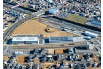
空から見た東鉄総合研修センター

今回は、みらい平駅からほど近く、TXとも関係の深い東鉄工業株式会社「東鉄総合研修センター」