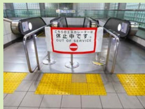
エスカレーター停止中の標識幕

秋葉原駅・浅草駅・北千住駅・六町駅・南流山駅・流山おおたかの森駅・守谷駅・つくば駅