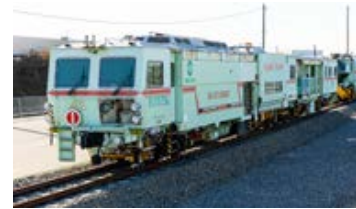
線路のゆがみや碎石を突き固める大型保線機械。操作技術や資格取得に大活躍

備、教室、図書室、カフェレストランなどがあり、社員同士のコミュニケーションの場ともなっています。