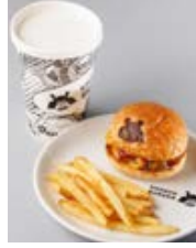
キッズチーズセット(880円/税別)