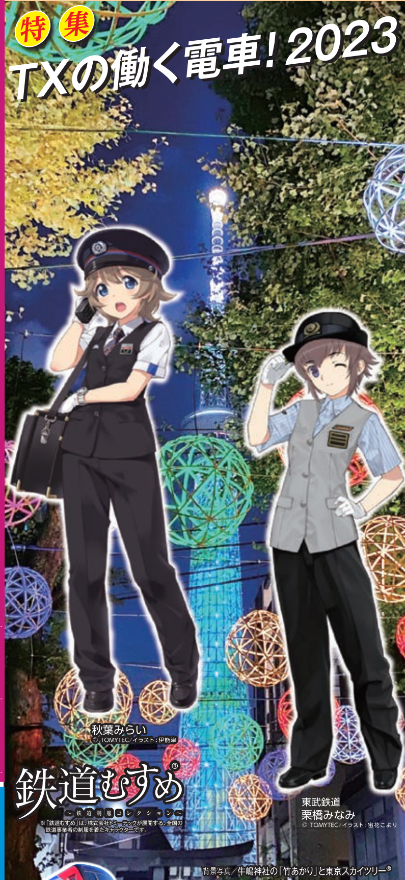
秋葉みらい © TOMYTEC/イラスト:伊能渾

鉄道むすめ ~鉄道制服コレクション~ ※「鉄道むすめ」は、株式会社「S=アック」が展開する、全国の鉄道事業者の制服を着たキャラクターです。