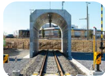
全長15mの鉄筋コンクリート製トンネルで、ひび割れなどの劣化を点検する研修施設