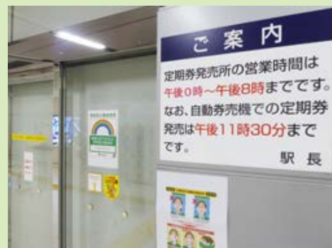
定期券発売所（秋葉原駅）