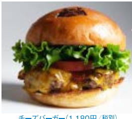
チーズバーガー(1,180円/税別)