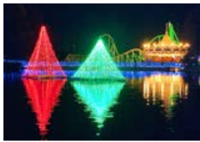
東武動物公園のイルミネーション

遊園地・動物園・プールが融合したレジャー施設東武動物公園。人気のホワイトタイガーや30種類のアトラクションが楽しめます。冬季イルミネーションも開催中! お出かけ前に