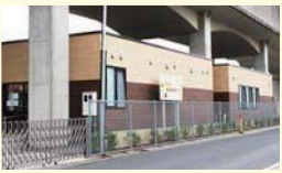
学童保育施設 ちくみキッズクラブ

今年4月に八潮駅高架下の学童保育施設を整備しました。今後も沿線における子育てや教育しやすい環境の創出に積極的に協力します。