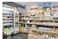
つくばの名品が並ぶ店内