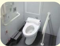
流山おおたかの森駅に設置された温水洗浄便座

3月に流山おおたかの森駅および守谷駅の旅客トイレに便座温水洗浄便座を導入しましたが、今年度は新たに秋葉原・浅草・八潮・つくばなど9駅に導入します。