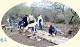
木製レンガ路の修復作業の様子

昨年度から開始した同プロジェクトでは、木製レンガ路の修復作業等に参加しました。今年度も引き続き協力していきます。