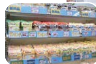
どこかかわいい お店の全景(上) と、美味しさあふ れる店内(左)

る全国各地の有名な果物や名物などのコラボに よる新商品も大好評で、多くのお客さまが楽しみに しているそうです。最近「東京土産」として話題の 「ちよいパクラスク」は、パンの耳をカラッと焼き上げた サクッとした新食感のお菓子。ぜひご賞味ください。