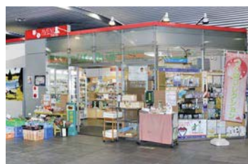
つい入ってしまうようなお店の雰囲気