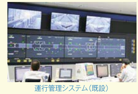
運行管理システム(既設)