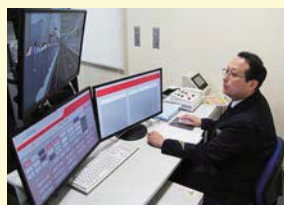
教師用操作卓では、乗務員室内に設置されているカメラで訓練乗務員の様子を確認できる