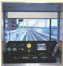
密席側から乗務員室を見た光景は、各種機器、車窓とも実物車両とほぼ同じ(画像は万博記念公園駅1番線到着時の状況)

4月に守谷講習室内に設置された運転シミュレータは、縦2.1m×横3.0m×高さ2.4mの模擬車体です。前方に70インチのディスプレイを3面・側面に32インチのディスプレイを2面と、補助モニター用に19インチのディスプレイ1面が配置され、その画面には、TXの路線をCGで再現したものが映し出されます。運転台をはじめとした機器類は、すべて実物車両と同一で、実際の乗務員室内の環境を再現していることから、臨場感あふれる訓練が可能です。