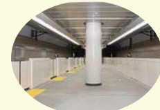
ホーム延伸工事の実施事例(2012年度 南流山駅)