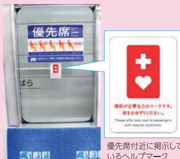
優先席付近に掲示しているヘルプマーク

ヘルプマークを付けている方を見かけましたら、席をおゆずりいただくなど、お客さまのご理解とご協力を願います。