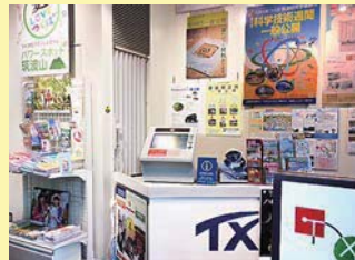
トラベルガイド(画面左)や、デジタルサイネージ(画面中央)が設置されている「TX PLAZA 秋葉原」内

「東京観光案内窓口」は、東京都が観光案内機能の充実に向け窓口を整備する取組みで、外国人旅行者に対する観光情報等の提供や多言語への通訳サービス、トラベルガイド(9言語10種類※)の配布等を行っています。