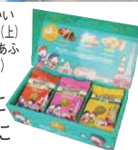
人気上昇中の 「ちよいパクラスク」 東京限定アソート (1箱 1,080円)