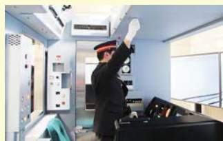
訓練中、前方の架線に飛来物を発見したため、パンタグラフを緊急降下する訓練乗務員

運転シミュレータを使った訓練は、こうした項目を教育担当の指導者が、教師用操作卓にて再現し、時には総合指令所長の役回りしながら、訓練乗務員の異常等発生時における対応や、各種機器の操作状況を把握し、習熟度を確認した上で、振り返り指導などを行っています。こういった訓練を、実車を使った教育訓練とは別に、全乗務員(約120名)が年6回(各1時間程度)ほど行い、異常時対応能力を向上させ、お客さまに安心してご利用いただけるよう努めてまいります。