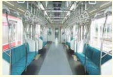
ロングシート化した車両

特に朝ラッシュ時の混雑緩和を図るためボックスシートが残っている7編成について、ロングシートへの改修工事に着手します。