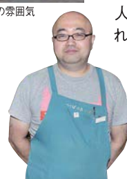
とても親しみやすい 沼尻店長