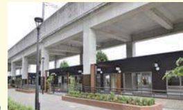
商業施設を整備中の柏の葉キャンパス駅高架下(2018.5撮影)

まもなく、小型飲食店舗とランニングステーションを兼ね備えた商業施設がオープンします。