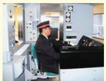
運転シミュレータ ※詳しくは4ページの「教えて!TX」をご覧ください。