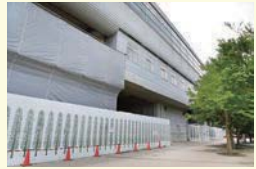
複合商業施設とIC専用改札口を整備中の流山おおたかの森駅高架下(2018.5撮影)

今年秋に、当社の高架下では最大の複合商業施設がオープンします。これに伴い、同駅南側にIC専用改札口を新設します。