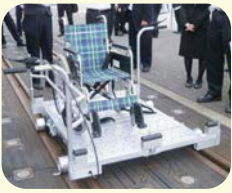
ハンディマルチ搬送トロ

駅間に列車が停止し運転不能となった際、お身体の不自由なお客さま等を安全に駅まで搬送する手押し車の配備を進めます。