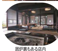
囲炉裏もある店内