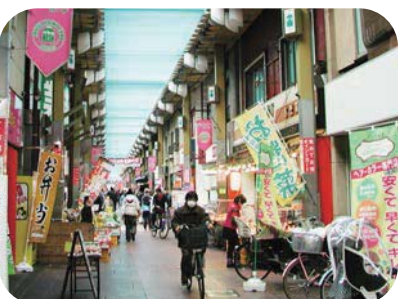
庶民的な親しみやすさが心地良いジョイフル三の輪

◎南千住駅下車、徒歩約12分 ◎03-3807-5181 (汐入公園サービスセンター)