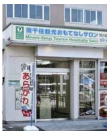
南千住観光おもてなしサロン