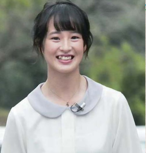
厳しい勝負の世界を生きるジョッキーとは思えないこの笑顔

という馬で中央競馬初勝利！11月27日現在、中央競馬で5勝、地方競馬で8勝と、女性騎手では過去最高ペースで勝ち星を積み重ねています。10月中旬、出身地の守谷市を訪れとお聞きし、お話を伺いました。