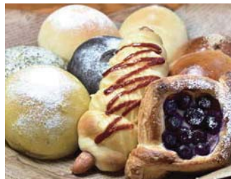
焼き立てのパン(上)と、野菜が美味しいサンドイッチやハンバーガー(下)

8時開店・駅前の便利さからテイクアウトも多い一方、サービスのコーヒーと一緒に店内・テラス席で味わうことも可能。広いキッズルームや屋外の遊具がベビーカーのお母さん