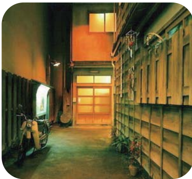
懐かしい路地と長屋の復元

荒川区の歴史・文化を楽しみながら学び、探求する場として平成10年5月に開館した施設。常設展示室には、発掘された土器、近世の千住大橋の模型などが展示され、特に、下町風情あふれる昭和41年頃の復元家屋は、懐かしい往時