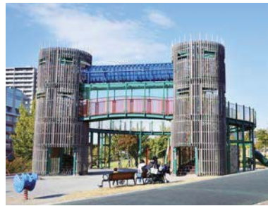
子供たちにも人気の汐入公園

◎南千住駅下車、徒歩約12分 ◎03-3807-5181 (汐入公園サービスセンター)