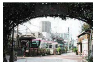
商店街に隣接する都電荒川線、三ノ輪橋

店先で気軽に店員さんたちと会話をしながら買い物ができる、とても人情豊かでホッとする街です。