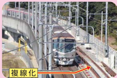
入出庫線複線化工事(11月現在)

TXでは、さらなる安定輸送確保・利便性の向上に向け、平成29年度の完成を目前に、守谷駅と総合基地を結ぶ「入出庫線の複線化」と駅構内の「追越設備新設」工事を行っています。現在、入出庫線複線化と追越設備新設は共に、軌道工事がほぼ終了し、電気工事を行っています。