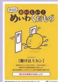
マナーポスター(駆け込ミカン)

TXでは、全駅および全列車内に可愛い駄ものが描かれたマナーポスター“くだものシリーズ【めいわくだもの】”を掲出し、お客様に楽しみながらマナーへのご理解とご協力をお願いしています。