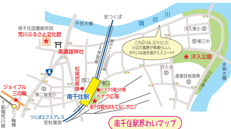
南千住駅界わいマップ