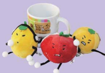
【めいわくだもの】グッズ

このたびマナーポスターに登場するキャラクターがお客様から大変ご好評をいただいていることから、