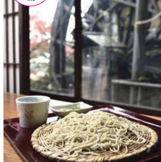
打ちたてのそば(写真裏は水車)