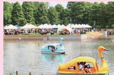
ポート池湖畔にあるバーベキュー場

でも、これからの季節、見逃せないのが園内に咲き誇る花々でしょう。桜の名所としても知られていますが「バラ園」も大人気。ただし、バラ園は春と秋の開花時期のみの開園です。HP等で確認のうえお出かけください。また、「ポート池」湖畔にはレストハウスもあり、予約すれば「バーベキュー場」も気軽に利用できますので、グループ、ファミリーでぜひお出かけください。