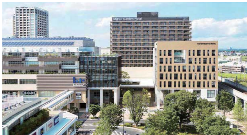
街のあらゆる機能をつかさどるゲートスクエア