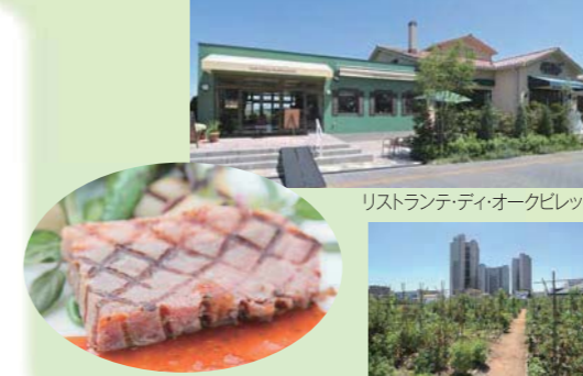
ダイニングコース料理より

食と農をテーマに、食の安全性や食の楽しさを追及しながら地産地消をめざし、自然とのふれ合いを大切に、オーガニックライフスタイルを基にした、地域の活性化に寄与するコミュニティスペースを提案。有機野菜を栽培するため体験型貸農園「オークファーム」や、レストラン、ウェディング施設など、新しい街の興味しんしんの複合型施設。(☎04-7170-1350)