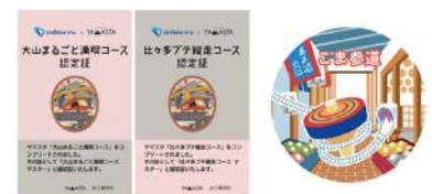
認定証・缶バッジ

( https://yamasta.yamakei.co.jp/info/oyama2022.html )