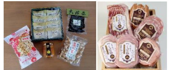
特産品詰め合わせ例（左：伊勢原 右：つくば）