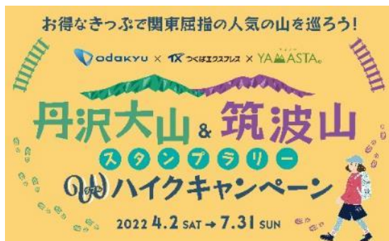
イベントポスター（イメージ）

関東近郊にある大山と筑波山は、それぞれでヤマスタのスタンプラリーを実施しており、いずれのコースも非常に人気が高く、今回連携キャンペーンを実施することとしました。デジタルスタンプラリーにより非接触で参加することができる本企画を通じて、両山での抜群の眺望や豊かな自然、奥深い歴史や文化などをお楽しみください。