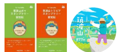
認定証・缶バッジ

( https://yamasta.yamakei.co.jp/events/tsukuba2021_2.html )