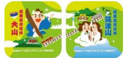
Wコンプリート缶バッジ