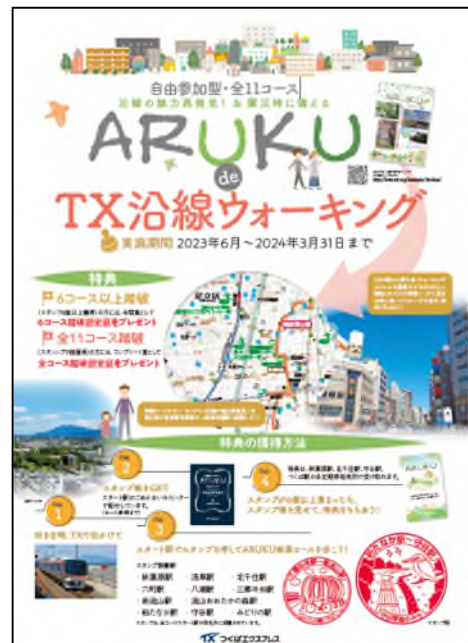
「ARUKU de TX沿線ウォーキング」 ポスターイメージ

https://www.mir.co.jp/towntopics/brochure/