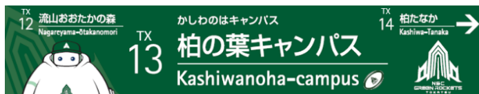
デザインイメージ