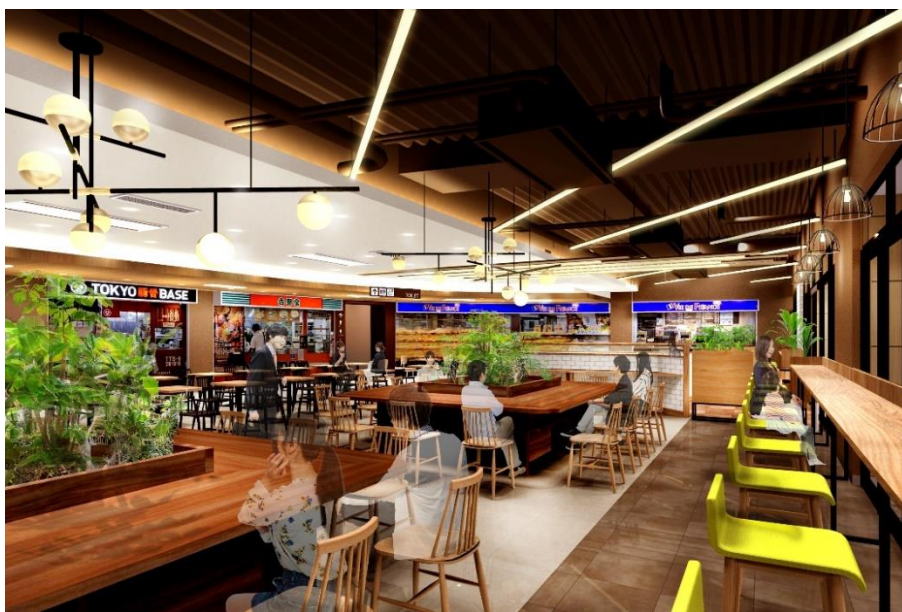
改装後イメージ：店舗内

落ち着きを感じる木目や自然の色により、あたたかみのある空間を創出するとともに、木調ルーバーとライン照明の連続感により、気軽に立ち寄れる空間でありながら、人の流れを作り出す空間構成としています。