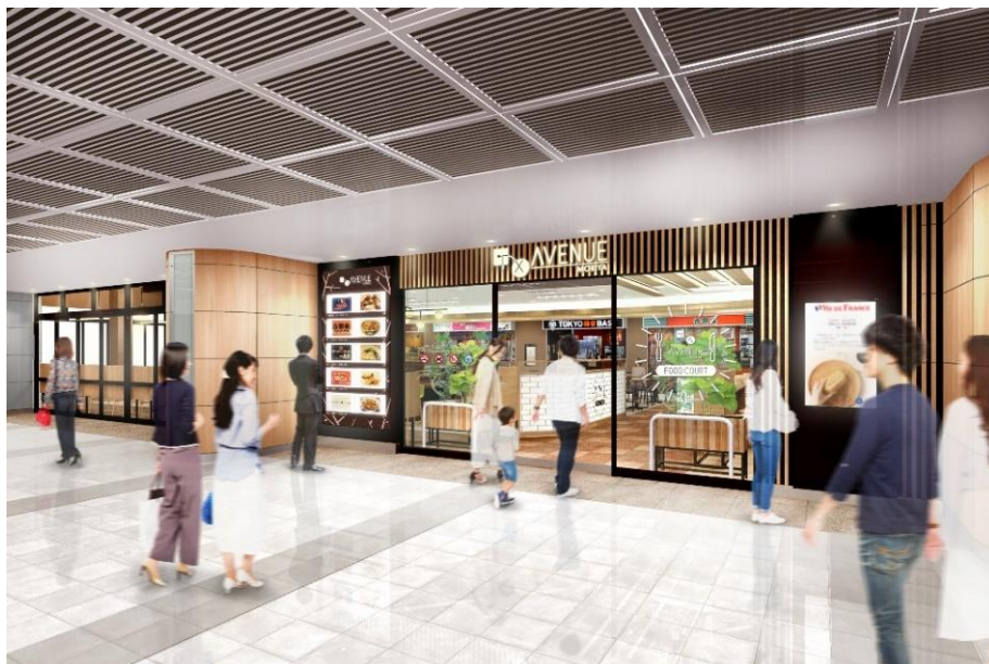
改装後イメージ：エントランス

※TX アベニューは、駅ナカ・高架下を活用した当社の複合商業施設です。現在、守谷駅のほか、八潮駅、流山おおたかの森駅、柏の葉キャンパス駅、つくば駅の計5箇所で営業しています。