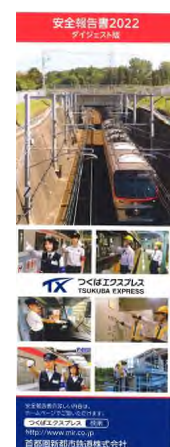
ダイジェスト版 表紙