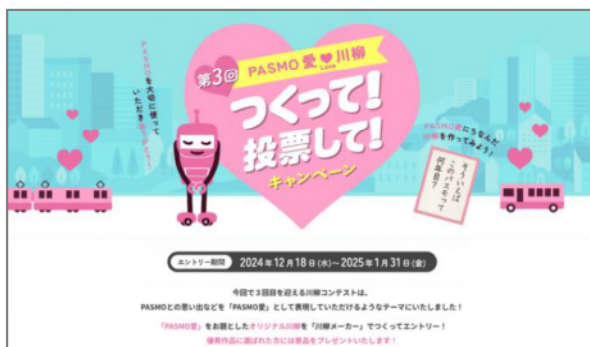
(キャンペーンサイトイメージ)

皆さまそれぞれの「PASMO 愛」あふれる作品のエントリーをお待ちしております。