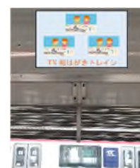
車両窓上スペース