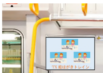
車両ドア横スペース