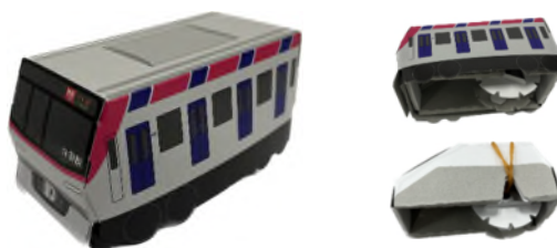
TX-3000系オリジナルプルバック電車 (紙製組立て式の完成品)