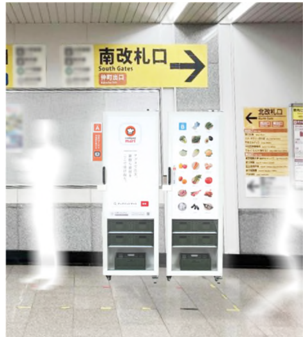
TX 北千住駅 マートステーション設置イメージ