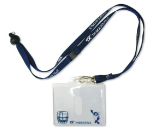
「TX オリジナル チケットホルダー」

『TX&サイエンスきっぷ』をご購入のお客様には、 「TX オリジナルチケットホルダー」と、つくば駅前の 商業施設つくばクレオスクエアや西武筑波店の一部店舗 において使用できる「グルメクーポン」をプレゼントい たします。