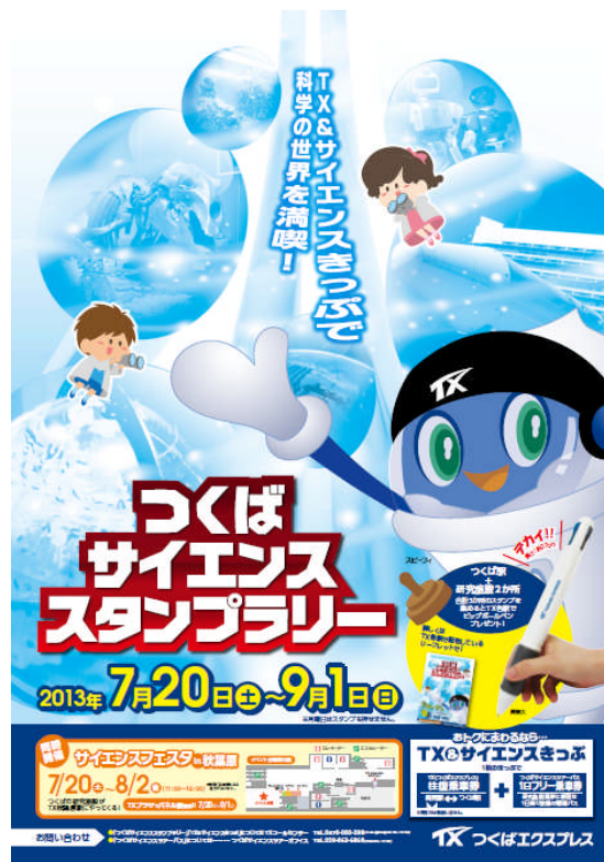
スタンプラリー告知ポスター