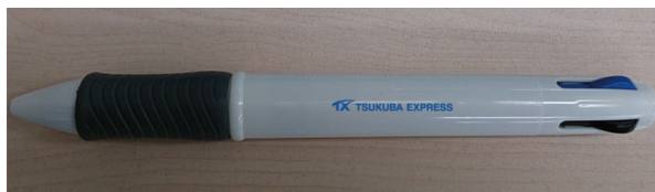
参加記念品「ビッグボールペン」 (イメージ)