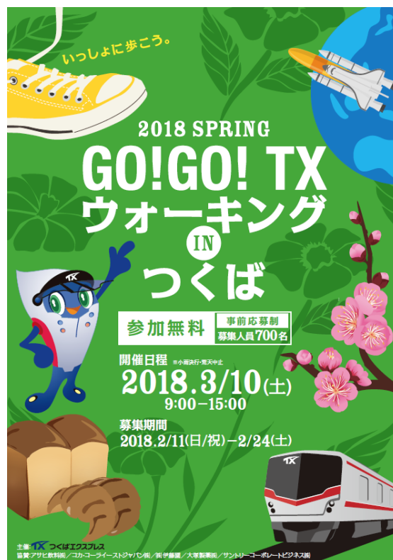
イベントポスター (イメージ)

新緑を感じる3月に、ご家族やご友人と一緒に、つくばの散策に、是非、お出掛け下さい。 詳しくは、別紙をご覧ください。