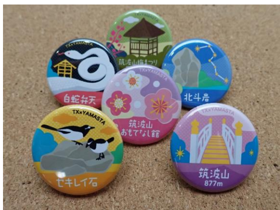
オリジナル記念缶バッジ（デザインはイメージ）

※2 ピンズは各コース、1回達成で1口応募できます（達成ごとに複数応募可）。必要事項を記載してメール（ヤマスタ事務局宛 yamasta-info@yamakei.co.jp ）にて応募ください。