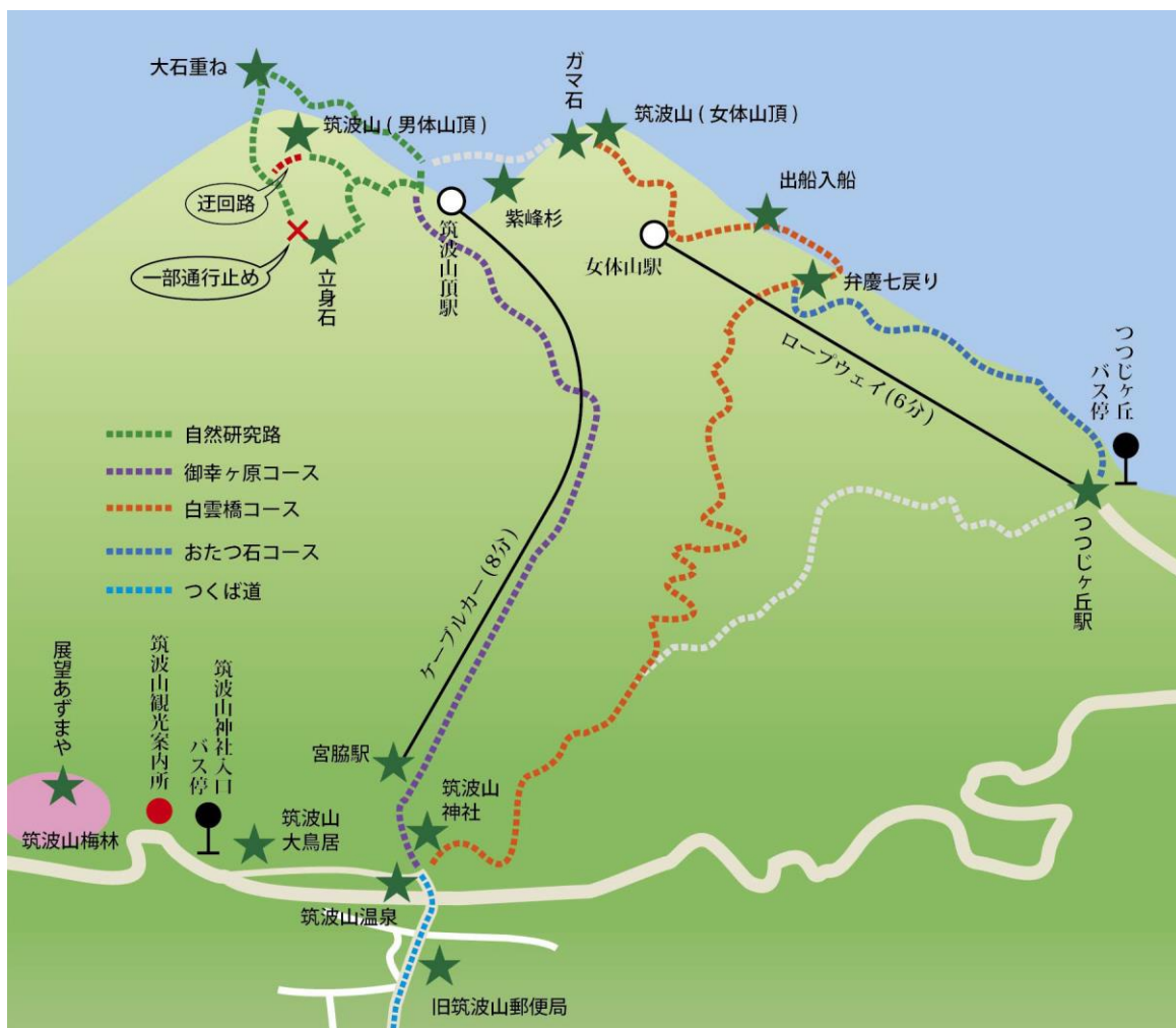
スタンプラリー コースマップ (★はチェックイン対象の場所)