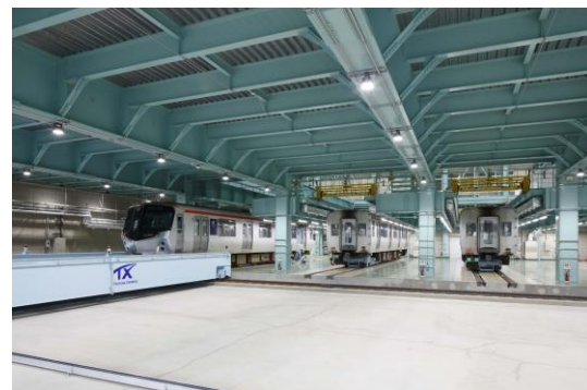
初公開の車体更新場