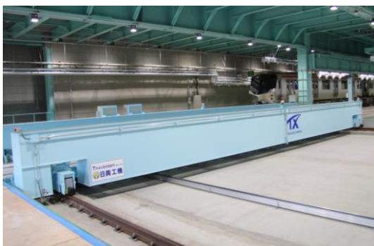
【車両を移動させるトラバースー】

平成 29 年 10 月 2 日（月）から稼動開始となりました車体更新場を初めて公開いたします。