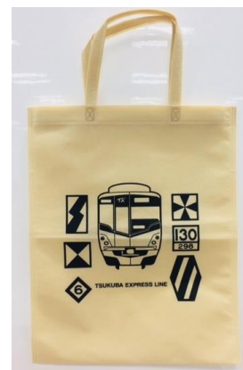
オリジナルエコバック(非売品)