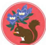
リンドウ(上)と ホンドリス(下)