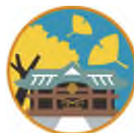
筑波山神社と イチョウ