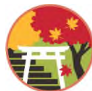
登山道入口と 鳥居