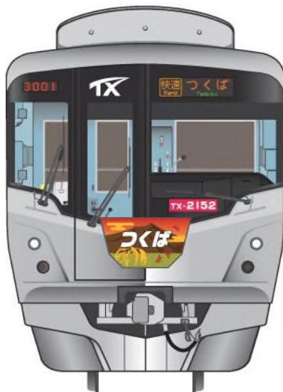
車両の前面部のヘッドマーク (1号車および6号車)