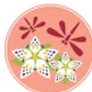
ナツアカネ(上)と アケボノソウ(下)