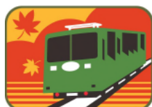
ケーブルカーと 紅葉