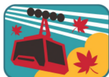
ロープウェイと 紅葉