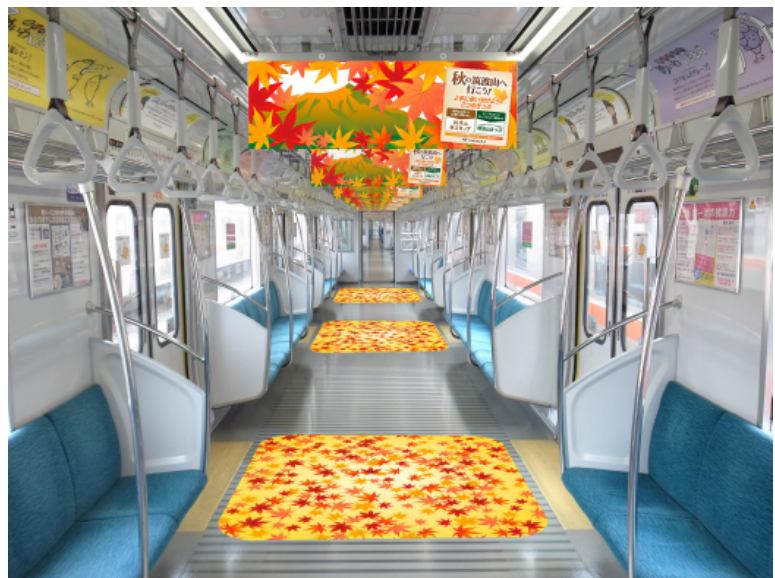
“中吊りポスター”と“床面のラッピング” (列車内)