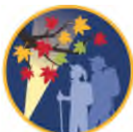
ライトアップされた 紅葉と登山者