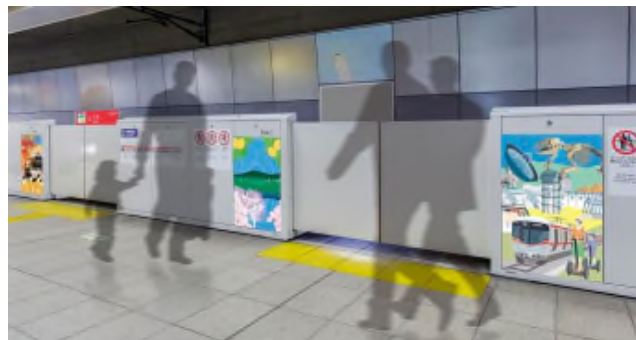
【ホーム柵 イメージ】