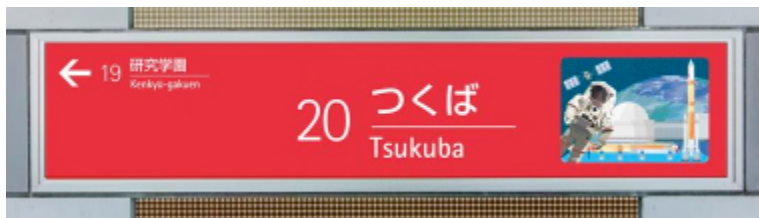
【つくば駅(1 番線) 駅名標 イメージ】