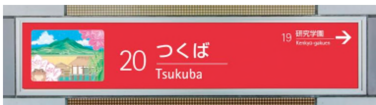
【つくば駅(2 番線) 駅名標 イメージ】