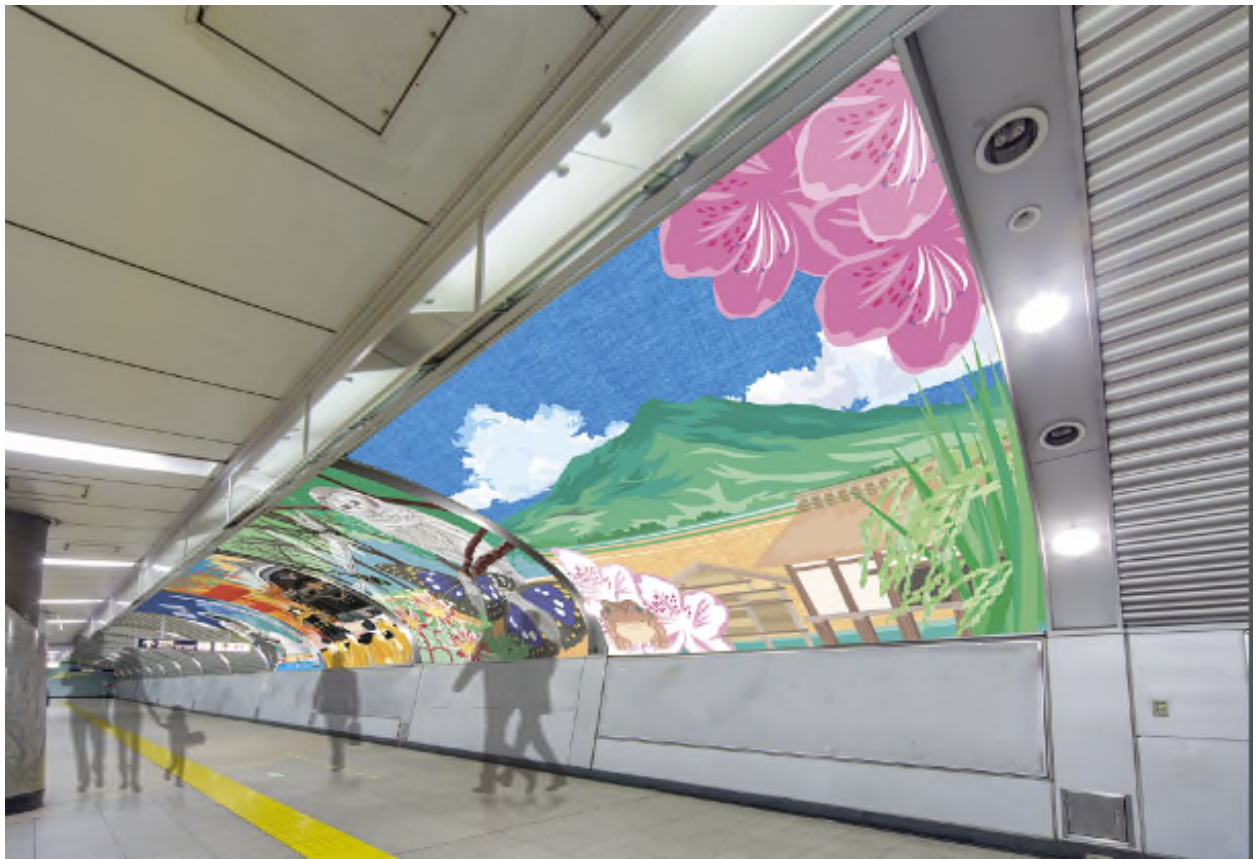
【つくば駅改札内コンコース 装飾イメージ】

観光やビジネス等でつくば駅へお越しになった際には、是非、駅構内の装飾もお楽しみ下さい。詳細は別紙のとおりです。