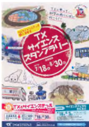
TX サイエンススタンプラリー パンフレット