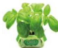
参加記念品「プチガーデンバジル」 (イメージ)