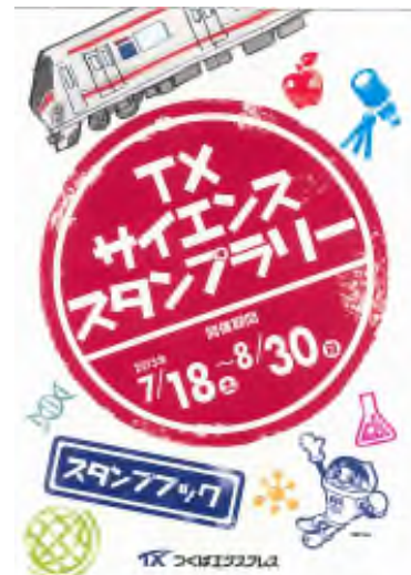
TX サイエンススタンプラリー スタンプ帳