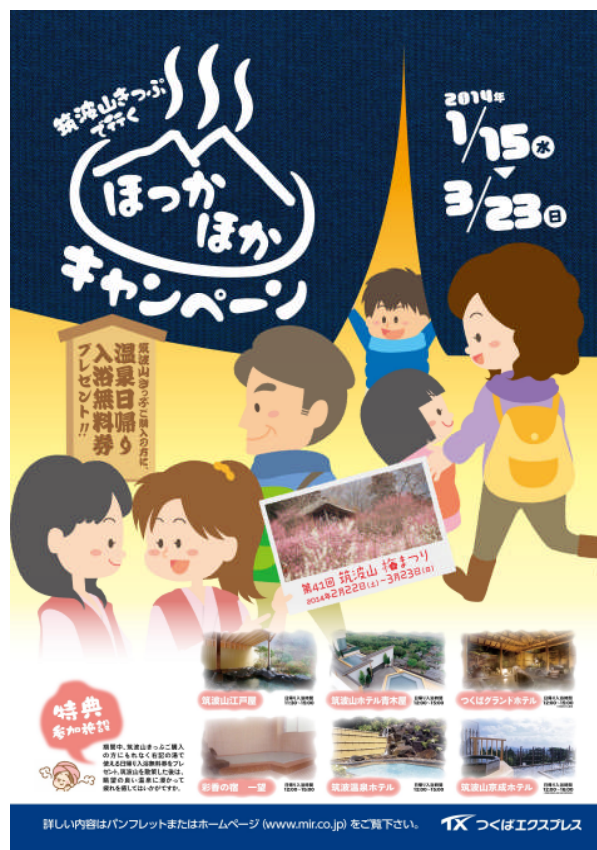
キャンペーン告知ポスター